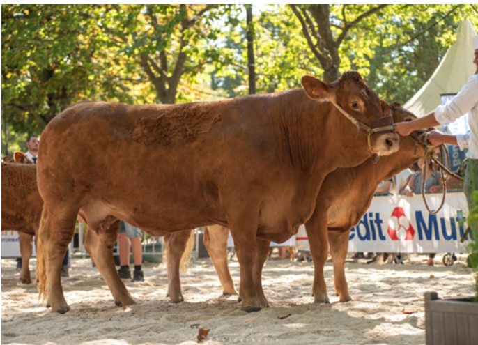
NELLYA au Gaec des 2 Vallées.