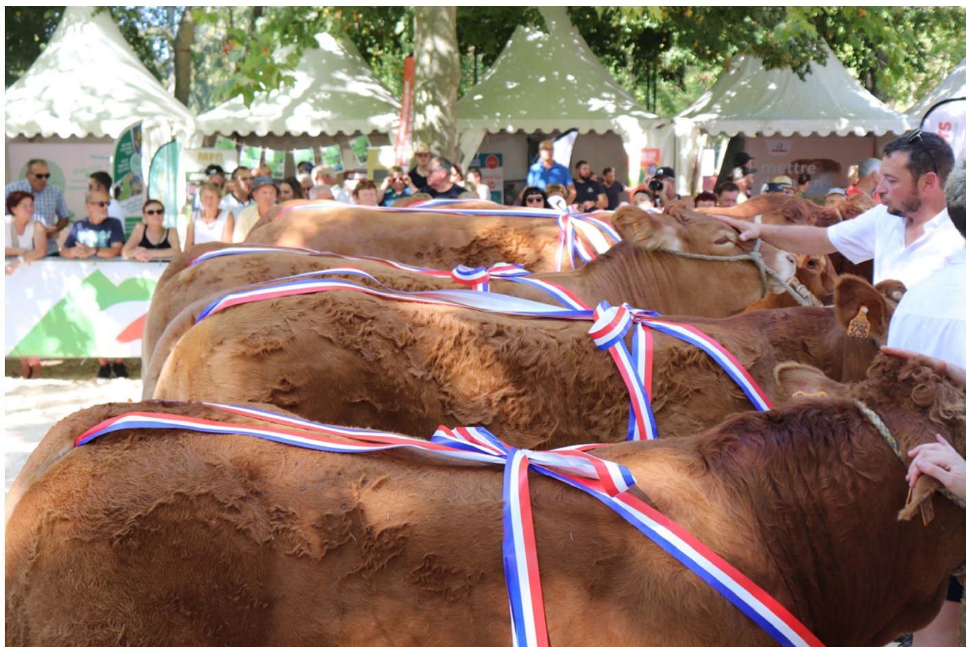
Les champions alignés.