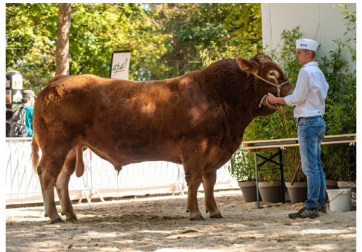
RADAR en copropriété au Gaec des 2 Vallées et à Earl Grandidider