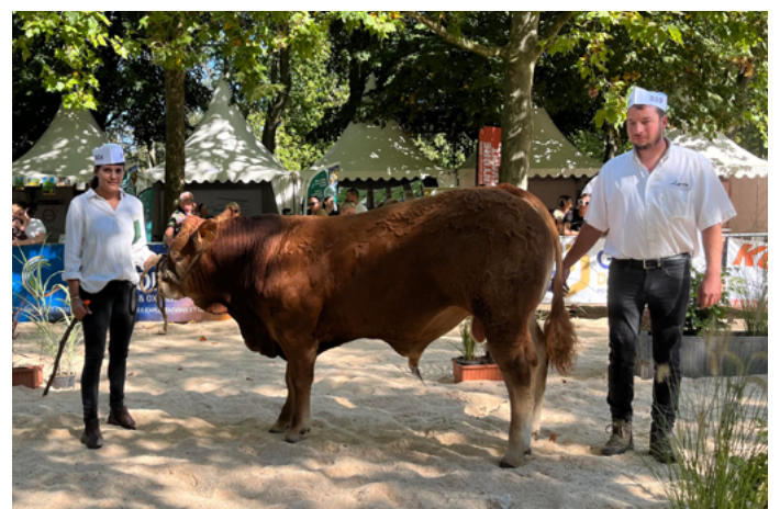
TRAGEDIE à l'Earl de la Maurelle.