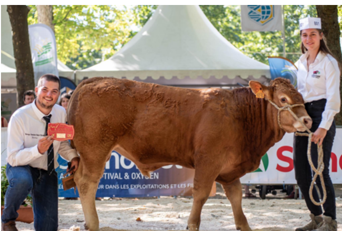
TICKET à l'Earl Domaine Saint Elevert.