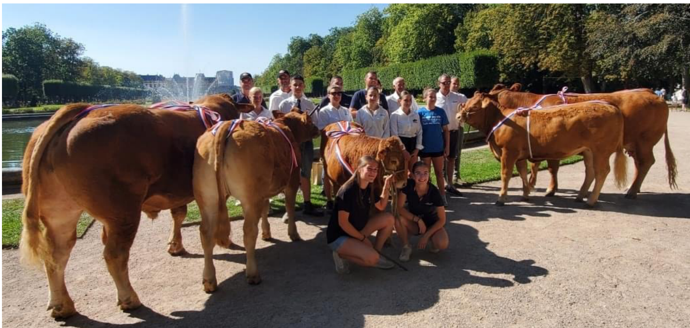
Les champions du concours sous le soleil.

Sous le soleil Lunévillois, six élevages de Moselle et Meurthe-et-Moselle se sont retrouvés pour un concours interdépartemental le 10 septembre. En effet, c'est au Parc des Bosquets, derrière le somptueux château, que s'est déroulé le premier concours d'automne tant attendu par les éleveurs.