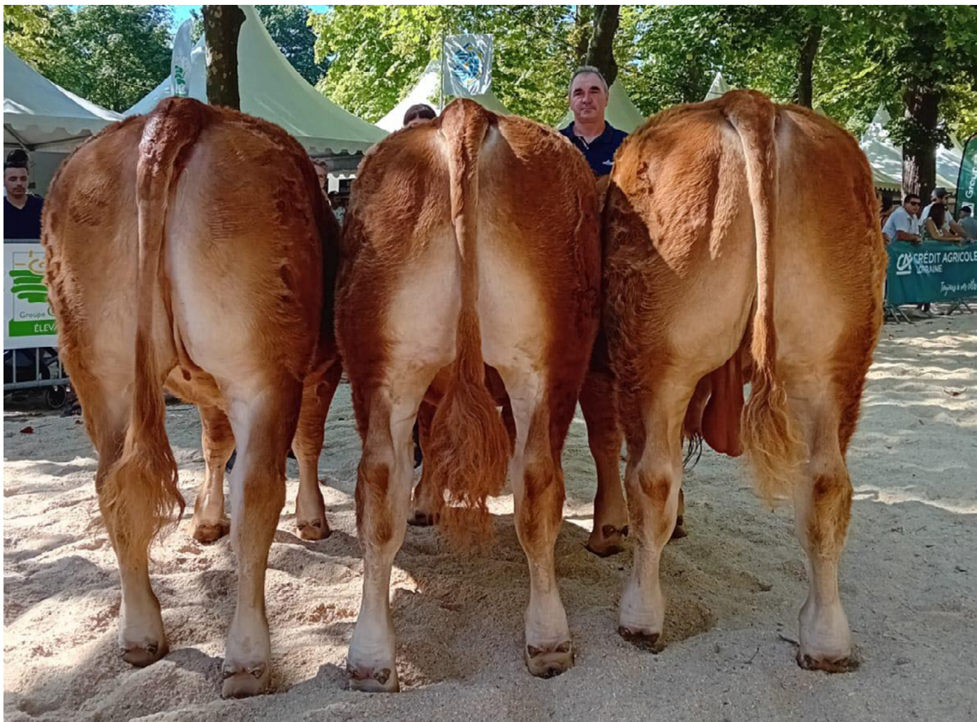
1 er prix d'Élevage - Earl de la Maurelle.