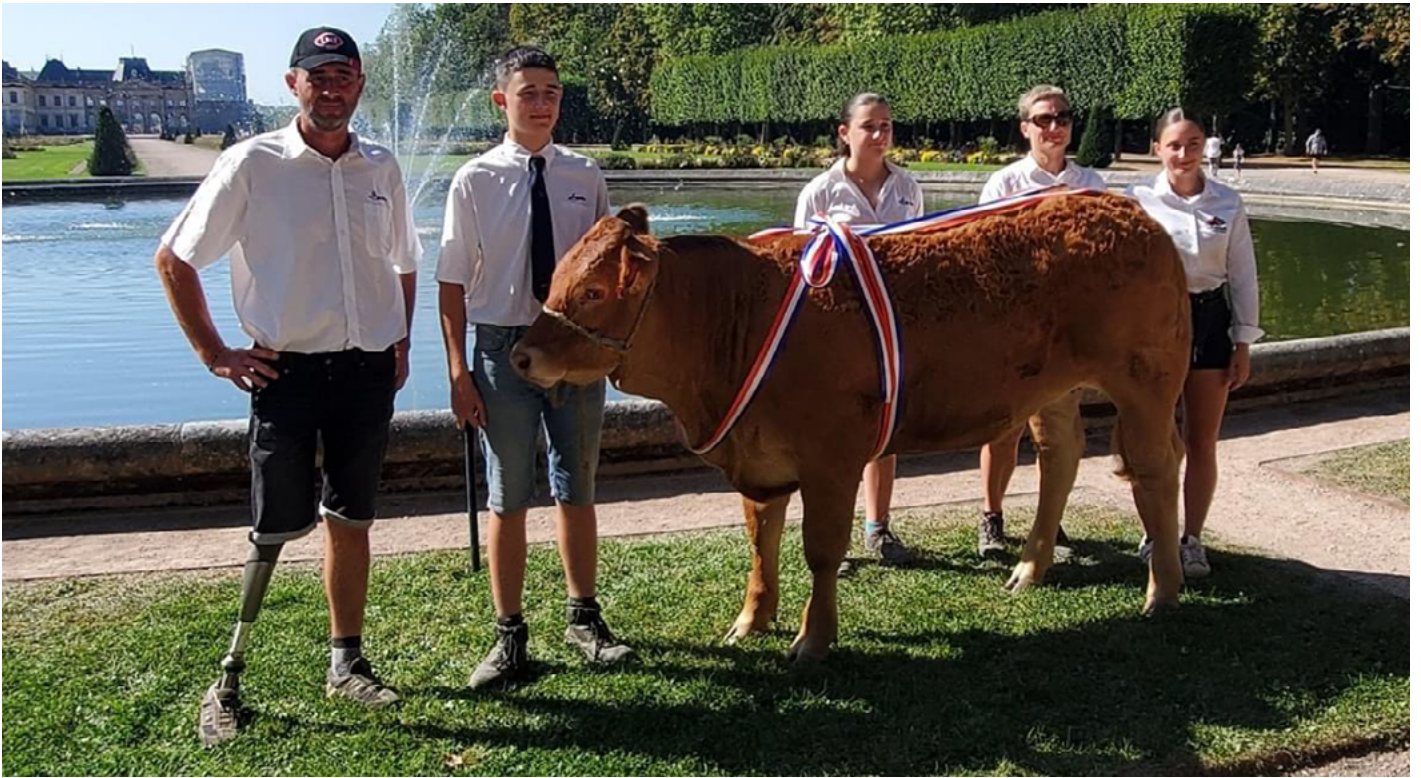
TITINE au Gaec du Patural.